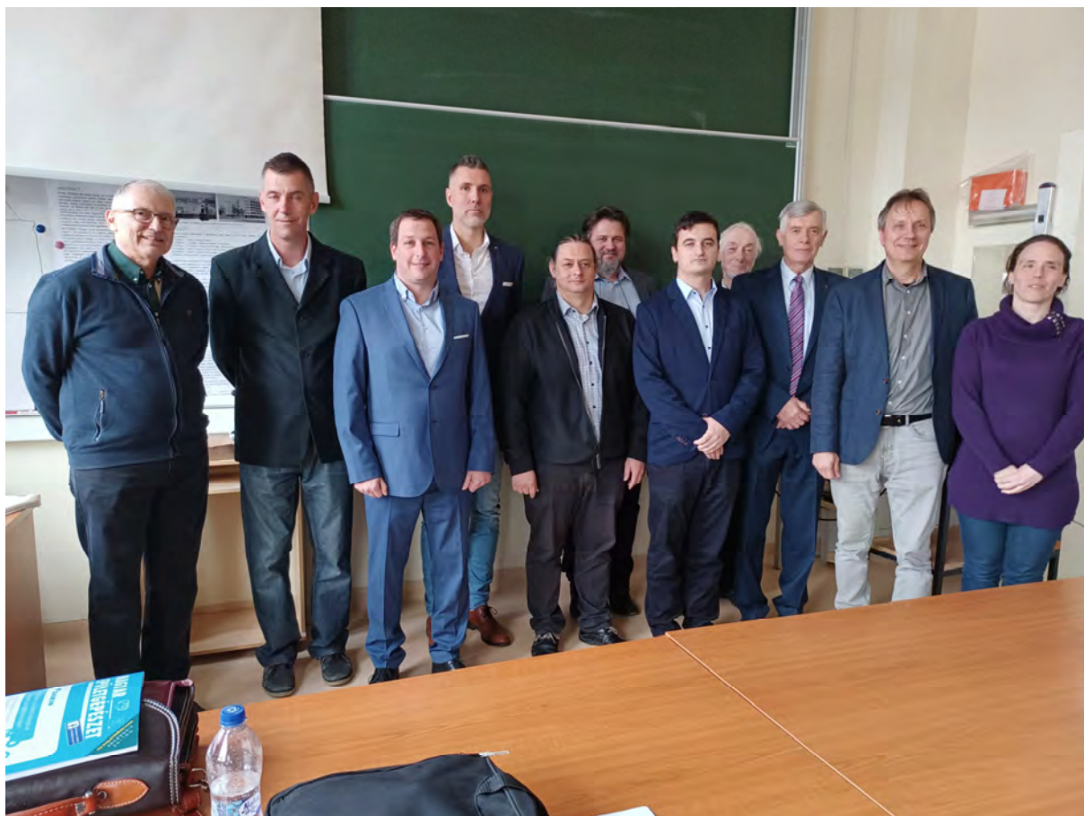
A prezentáción részt vevők és a Bíráló Bizottság tagjai

A tervpályázatra történő felkéréseket, a bírálatokhoz a pályamunkák letöltését és elküldését, az előzetes vélemények koordinálását, az opponensek felkérését, a prezentációkhoz a megfelelő helyszín és körülmények biztosítását annak reményében szerveztem, hogy ez a résztvevő tervezők számára hasznos és emlékezetes marad.